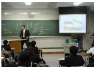
「環境と人間」をテーマに講義(横浜国立大学との連携)