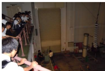
高電圧実験室で落雷を起こす実験を見学(東大の研究室)