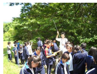
植物・森林・動物の野外学習(1年自然体験教室)